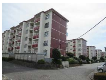
No. 10 グリーンハイムいずみ野F地区40号棟