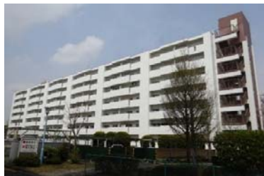
No. 83 ぐみさわ東ハイツ2号棟