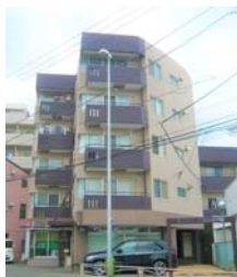
No. 20 内田マンション