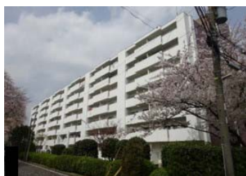
No. 85 ぐみさわ東ハイツ4号棟